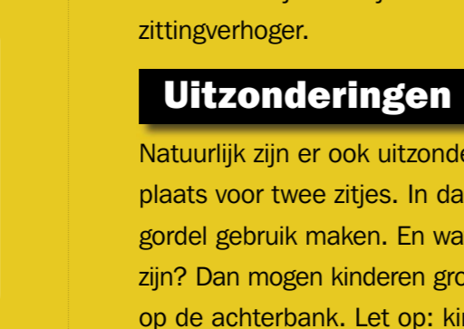
Kinderautostoeltjes zijn veilig en (dus) verplicht.

Daarom is in Europa afgesproken dat er strengere regels nodig zijn voor het vervoer van kinderen in de auto. Regels die maar een ding tot doel hebben: uw kind beter beschermen.