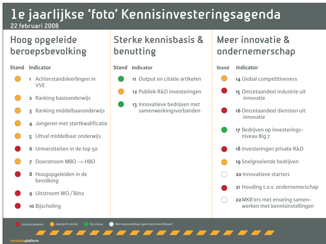
Figuur 2: KIA Foto

breedte hoog op de kwaliteit van onderzoek en is daarmee ook in staat om elders ontwikkelde kennis te absorberen. De laatste jaren is er meer geïnvesteerd in vraaggestuurd (bijvoorbeeld de Innovatieprogramma's) en praktijkgericht onderzoek (bijvoorbeeld RAAK en Vouchers). Er zijn prioriteiten gesteld in de vorm van sleutelgebieden en maatschappelijke thema's. De Technologische Top Instituten (TTI's) en Publiek Private Partnerships (PPP's) zijn succesvol en een voorbeeld in Europa. Toch blijkt dat de investering in kennisontwikkeling onvoldoende economisch en maatschappelijk rendeert (zie figuur 2: KIA Foto).