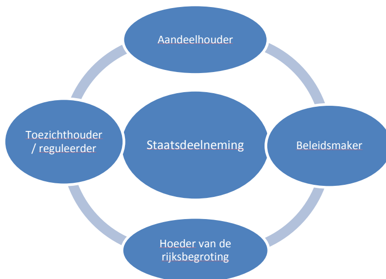
Figuur 1 Staatsdeelneming en de overheid