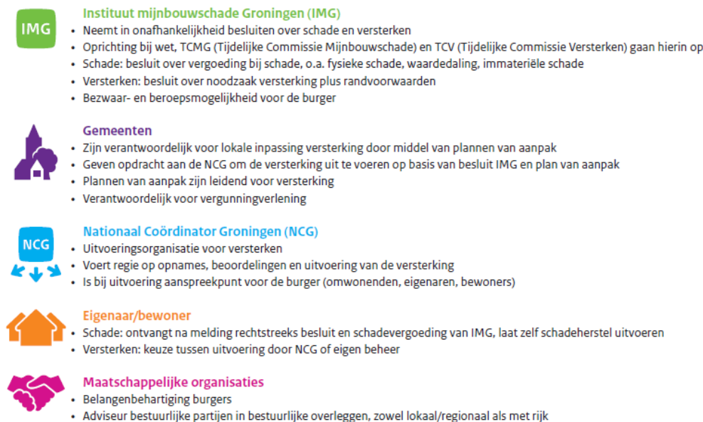
Figuur 2 – Het eindbeeld schade en versterken dat ontstaat na o.a. de wettelijke verankeringen van de nu per besluit vastgestelde werkwijze.