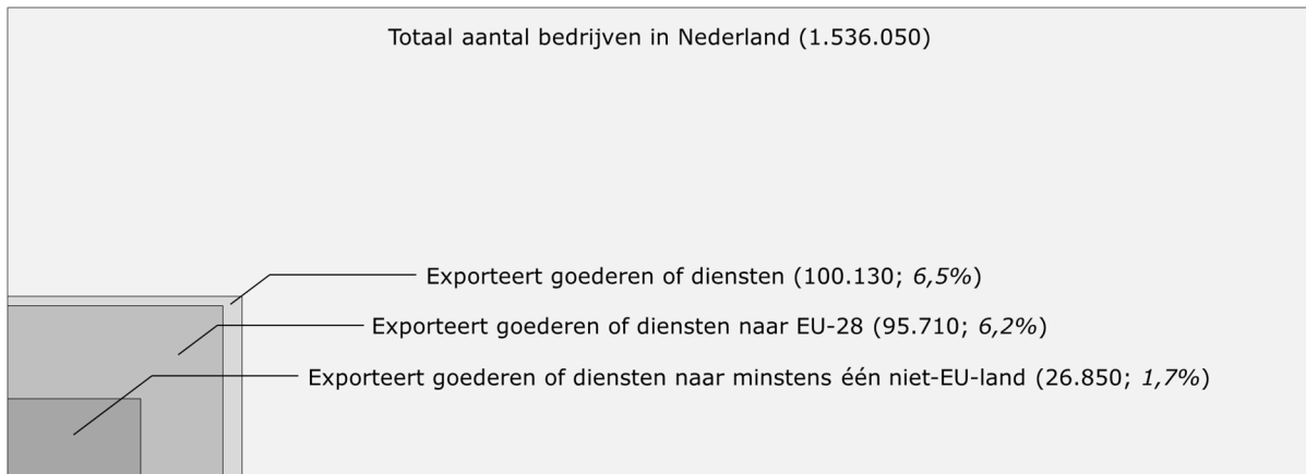
Figuur 1: Verhouding tussen het totaal aantal bedrijven in Nederland en het exporterende deel ervan (2016) 9 .