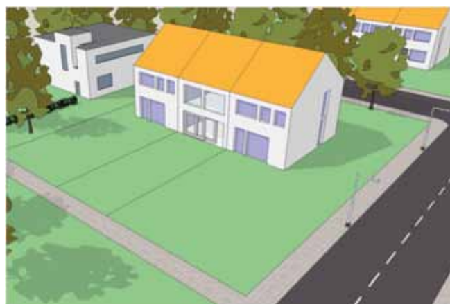
Aan de achterzijde mag de gevelindeling zonder omgevingsvergunning worden gewijzigd, in dit geval aan de zijgevel niet.

Belangrijk is waar u uw kozijn of gevelpaneel wilt veranderen of waar u een kozijn wilt plaatsen. In de regel geldt dat alles wat grenst aan openbaar toegankelijk gebied (de weg, openbaar groen of water), zoals de voorkant en bij hoekwoningen de zijkant van de woning, een grotere invloed heeft op de directe omgeving dan