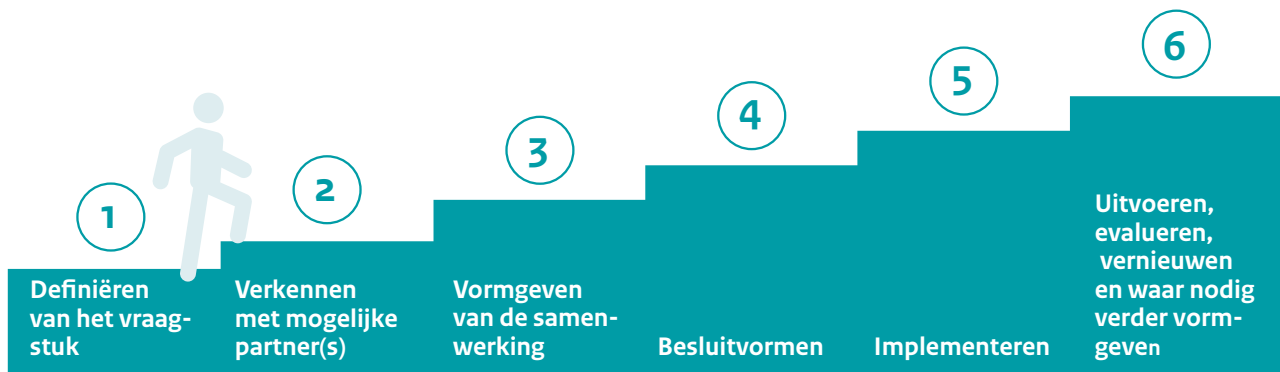
Figuur 3. Stappen in het samenwerkingsproces