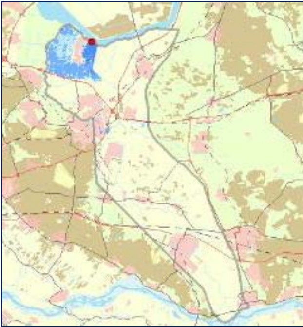
Figuur 1.2: Bres bij Wageningen: schade € 10 mld. en 100 tot 1000 slachtoffers