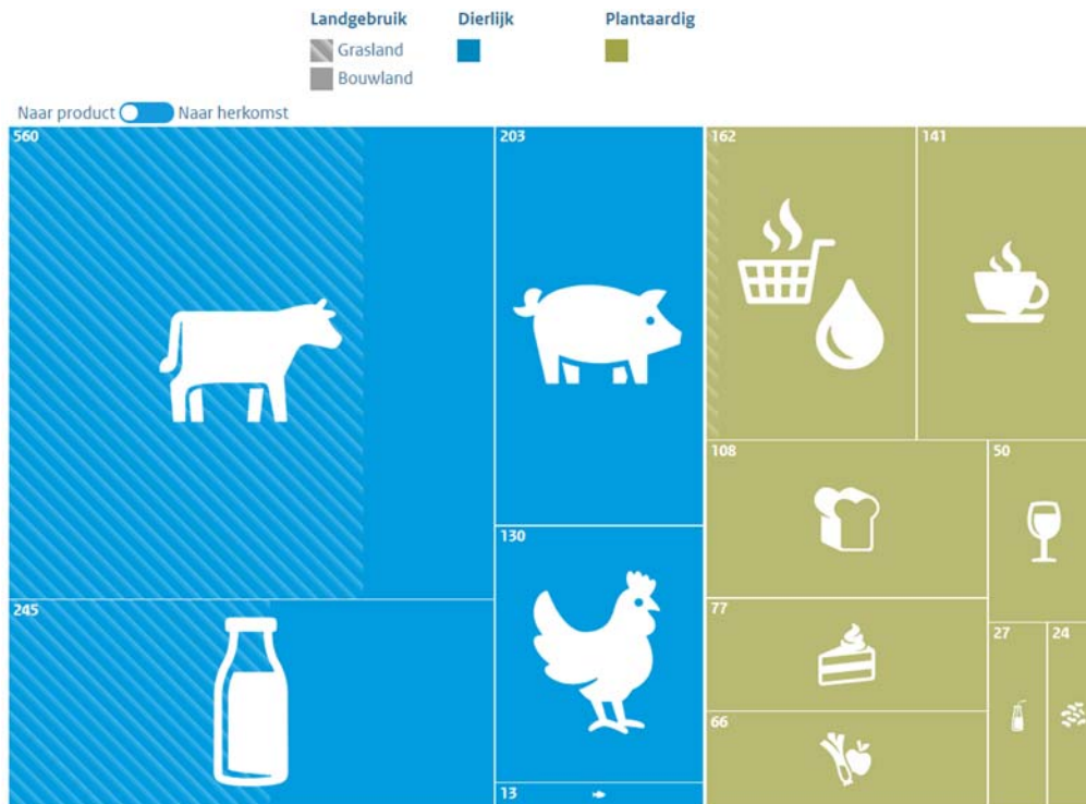
Figuur 1: Indicatieve geografische verdeling landvoetafdruk van de Nederlandse voedselconsumptie. 36

bedraagt: een kwart voetbalveld. Het grootste deel komt voor rekening van de consumptie van dierlijke producten (vlees en zuivel), zoals figuur 1 laat zien.