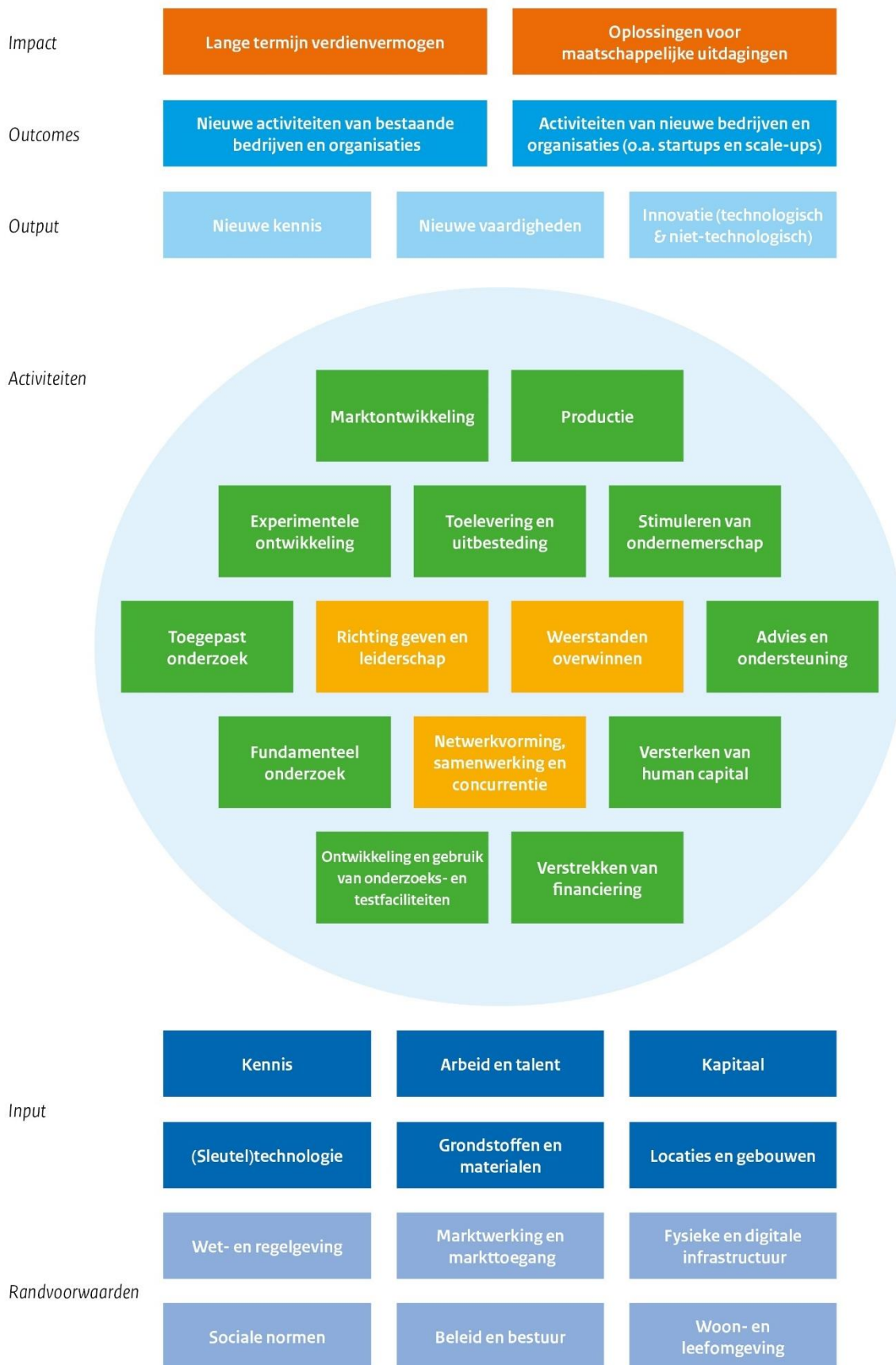
Figuur 2: Conceptueel kader van een onderzoeks- innovatie-ecosysteem