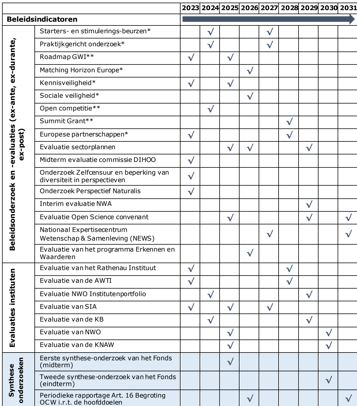
Tabel 2 Beleidsvaluatie Agenda voor het Onderzoeks- en Wetenschapsbeleid

* Evaluaties i.h.k.v. Fonds voor Onderzoek en Wetenschap