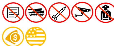
Figuur 1: overzicht sanctieverlichting Iran

Let op: in Nederland dient u zich aan te houden aan Nederlandse en Europese wet- en regelgeving. Desondanks kunt u toch te maken krijgen met Amerikaanse wetgeving. Transacties die op grond van Europese wetgeving geen probleem vormen (oranje iconen in figuur 1) kunnen mogelijk verboden zijn op grond van Amerikaanse wetgeving.