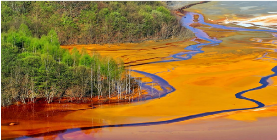
Een rivier in Bangla Desh, waarop textiel ververijen ongezuiverd lozen

Het is om die reden dat onderwerpen textiel recycling en hergebruik zo hoog op de (inter-) nationale agenda staan en dat zelfs de VN (in het kader van de klimaatdoelstellingen) belangstelling heeft getoond voor het initiatief bij het Rijk.