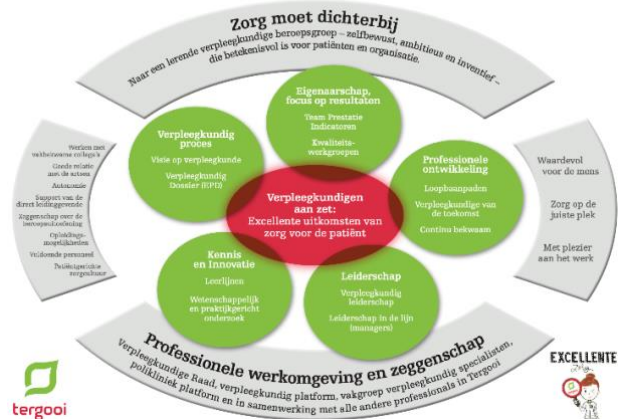
Professioneel Praktijk Model Verpleegkunde Tergooi

In Tergooi startten in 2016 de verpleegkundigen met een traject voor het verbeteren van de werkomgeving en professionele zeggenschap. Ter ondersteuning ontwikkelden zij het professionele praktijkmodel (figuur). Een nulmeting op basis van de pijlers Excellente zorg hielp de verpleegkundigen om te bepalen wat er nodig was om een sterke verpleegkundige organisatie neer te zetten. Een herhaalde meting in 2019 liet zien dat verbeteringen op alle Excellente zorg-pijlers zichtbaar was. Ook de komende jaren werkt Tergooi aan het versterken van de verpleegkundige organisatie en professionele zeggenschap, met elke drie jaar metingen zodat er inzicht is in de ontwikkelingen en waar nodig