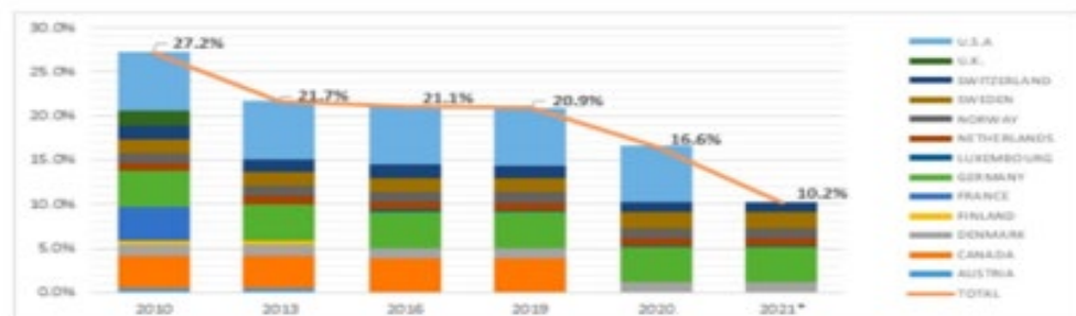
Figuur 1. Afname garantiestelling AfDB

Leek de financiële positie van de Bank jarenlang onwankelbaar – vooral door rugdekking in de vorm van garanties door lidstaten met een AAA-kredietstatus – het uitbreken van de Covid-19-pandemie bracht hierin verandering. Niet alleen zag een aantal Afrikaanse lidstaten hun kredietstatus naar beneden toe bijgesteld, waardoor de Bank extra risicokapitaal opzij moest zetten, ook Canada en de Verenigde Staten kregen te maken met een neerwaartse bijstelling van hun kredietstatus of een waarschuwing daartoe. De garantiestelling door AAA-lidstaten nam hierdoor met de helft af (vanaf 2010 gerekend met zelfs bijna twee derde), door factoren waarop de Bank geen invloed heeft.