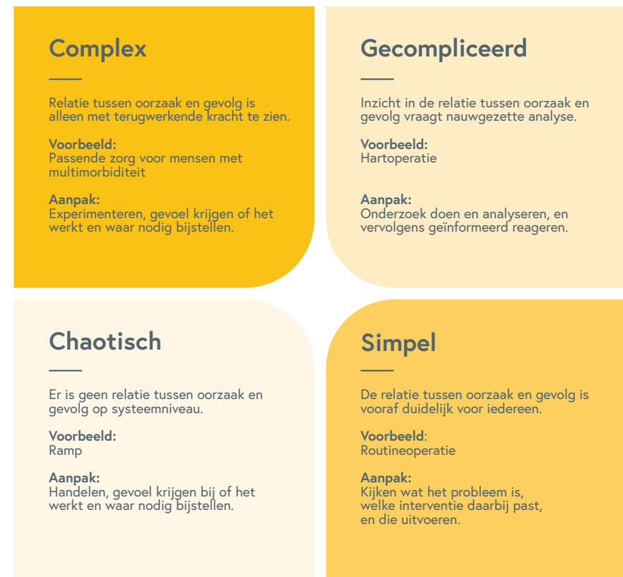
Figuur 2 Het Cynefin raamwerk

kijken wat werkt en wat niet; daar waar nodig beleid bijstellen; en zo oplossingen als het ware uit de praktijk laten opkomen (zie ook het kader hieronder).