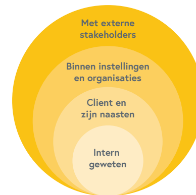
Figuur 3: Verantwoording als dialoog op verschillende niveaus

Het afleggen van verantwoording dicht bij de praktijk dient plaats te vinden op verschillende niveaus (zie figuur). Ten eerste vraagt dit om voortdurende zelfreflectie van professionals . Ten tweede vraagt het op het niveau van de zorgrelatie een dialoog met de patiënt, cliënt en/of mantelzorger . Ten derde vraagt het een dialoog op het niveau van de organisatie, bijvoorbeeld tussen bestuurders en zorgprofessionals, en tussen afdelingen onderling. Ten vierde vraagt het om een dialoog met externe partijen die actief meedenken.