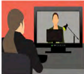
Interviews - Week 43 - 44