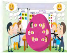
Terugkoppeling Observaties Week 45