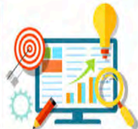
Analyseren IV/IT - Week 43 - 47