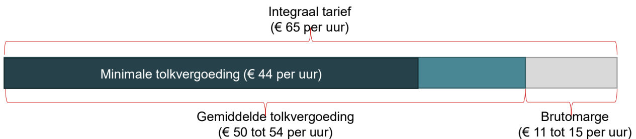
Figuur 2 Op basis van de huidige contracten ligt de brutomarge van intermediairs tussen de 17 en 23 procent

Figuur 2 laat de huidige opbouw van het integrale tarief zien. Van het integrale tarief van € 65 per uur in de huidige contracten gaat minimaal 67 procent – de wettelijke afgeronde € 44 per uur – naar de tolken en in totaal gemiddeld 77 tot 83 procent (€ 50 tot € 54 per uur) naar de tolken. 3 Dit betekent dat een tolk minimaal € 44 per uur vergoed krijgt en alle tolken gezamenlijk gemiddeld € 50 tot € 54 per uur. Hoe deze vergoeding verdeeld is over de verschillende tolken en tolkdiensten is echter niet bekend. Het gemiddelde van € 50 tot € 54 per uur kan bijvoorbeeld sterk opwaarts worden beïnvloed door het moeten leveren van enkele schaarse tolken waarvoor in de markt een hoger uurtarief geldt. Ter illustratie, als de intermediair in 15 procent van de gevallen een vergoeding van € 100 per uur hanteert, moet in de overige 85 procent een vergoeding van € 44 per uur gelden om uit te komen op de door de overheid gerapporteerde gemiddelde tolkvergoeding van tussen de € 50 en € 54 per uur.