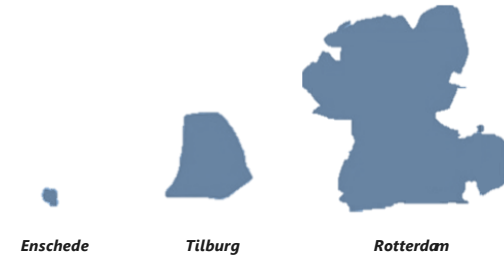
Figuur 1 – Voorbeeld van verschil in omvang van drie aangekondigde zero-emissiezones

De omvang van de zero-emissiezone is zeer wisselend en afhankelijk van de grootte van het stedelijk gebied, het ambitieniveau per gemeente en een logische kadering van de zone door (natuurlijke) inrichting van het gebied. Hierbij is zichtbaar dat (oude) stadskernen of ringwegen vaak gebruikt worden als uitgangspunt c.q. begrenzing voor een zero-emissiezone. Dit zorgt er ook voor dat de zero-emissiezones in sommige gevallen een groot deel van de gemeente omvatten, terwijl voor andere steden alleen de kern en dus een beperkt deel van de gemeente, inwoners en bedrijven worden beïnvloed.