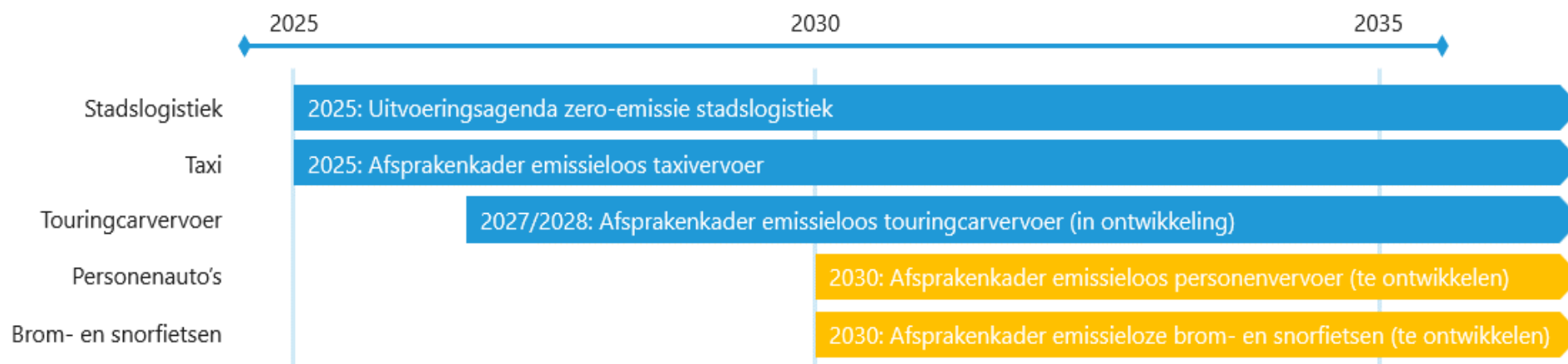
Figuur 4 – Aanbevolen tijlijn voor het toegangsregime van de zero-emissiezone en de betrokken afsprakenkaders per voertuigcategorie

afsprakenkader, waarna de uitgangspunten kunnen veranderen door ontwikkelingen in de praktijk. Daarom is het belangrijk de overgangsregelingen bij aanvang van toevoeging van een nieuwe voertuigcategorie aan de zero-emissiezone te evalueren.